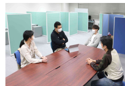
共有スペースでの交流

※賃料・使用料 無料 ※デスク/椅子/専用ロッカーを完備しています ※インターネット 無料 (Wi-Fi完備)