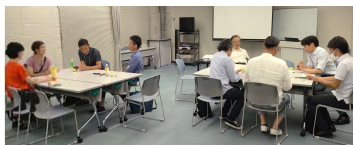
起業カフェの風景