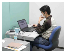
デスク使用イメージ